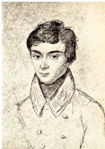
Évariste Galois (1811-1832)