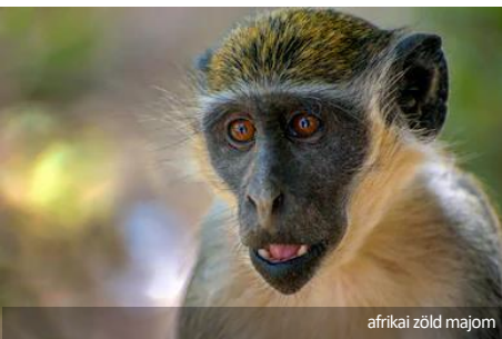
afrikai zöld majom

Folytatódik a SARS-CoV-2 számára megfelelő állatmodell keresése . Számos tudós kutat jelenleg olyan állati fajokat, amelyek úgy reagálnak a vírusra, mint az ember, hogy kutatási