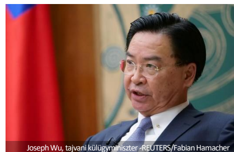
Joseph Wu, tajvani külügyminiszter

felülvizsgálatát. Mivel számos ország, köztük az Egyesült Államok nemrégiben fokozta támogatását Tajvannak a WHA 73-ba történő bevonására - különös tekintettel Tajvan