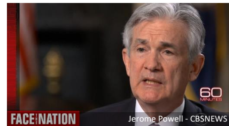
Jerome Powell

Tegnap Jerome Powell , az Egyesült Államok Federal Reserve elnöke kijelentette, hogy az Egyesült Államok gazdaságának teljes helyreállítása a vakcina