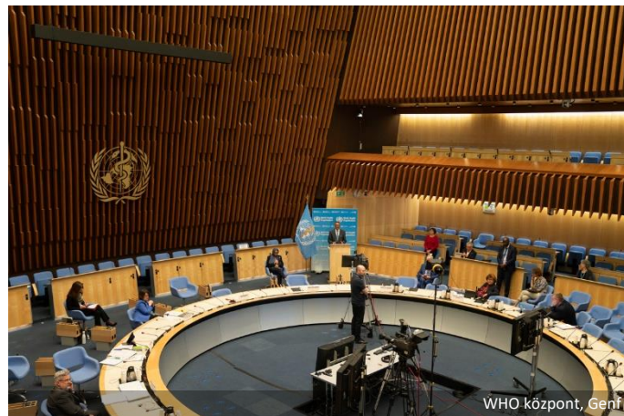
WHO központ, Genf

Hétfőn megkezdődött a 73. Egészségügyi Világggyűlés (WHA 73), a történelem során először virtuálisan . Közben számos egészségügyi kérdés van napirenden - beleértve a polio felszámolását, az elhanyagolt trópusi betegségeket és a Nemzetközi Egészségügyi Szabályzat végrehajtását -, a tárgyalás várhatóan nagy hangsúlyt fektet a COVID-19 világvárványra, valamint annak ellenőrzés alá vonásához szükséges mechanizmusokra és képességekre. Egy 41 különálló országból álló csoport, valamint az Afrika-csoport tagállamai és az Európai Unió javaslatot terjesztett elő, amely részben felszólít a WHO COVID-19 pandémiás védekezésének szisztematikus és független felülvizsgálatára a jövőbeni védekezések során használandó bevált gyakorlatok azonosítása érdekében. Ezenkívül a javaslat arra utasítja a WHO-t, hogy folytassa az együttműködést az Állategészségügyi Világszervezettel, többek között a járvány zoonózis-eredetének meghatározása terén.