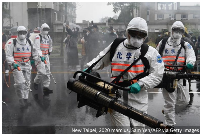
New Taipei, 2020 március

Az Egyesült Államok által támogatott blokk arra is törekszik, hogy Tajvan, akinek víruskezelése ritka