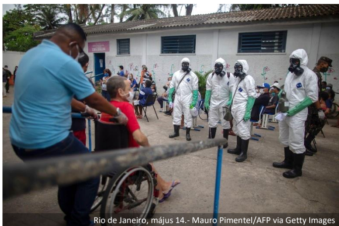
Rio de Janeiro, május 14.

Brazília a pénteki rekordszámú fertőzés után újabb esetekről számolt be, felülmúlva ezzel Spanyolországot , mint a világ negyedik legmagasabb számú megerősített COVID-19 beteget számláló országát. Az ország szombaton 14 919 esetet regisztrált a kormány adatai szerint, az esetszám így összesen 233 142-re emelkedett. Az ország az Egyesült Államokat, Oroszországot és az Egyesült Királyságot követi. A szám meghaladja Spanyolországi vasárnapi 231 350-es esetszámát, amely a járvány leküzdése érdekében a rendkívüli állapot