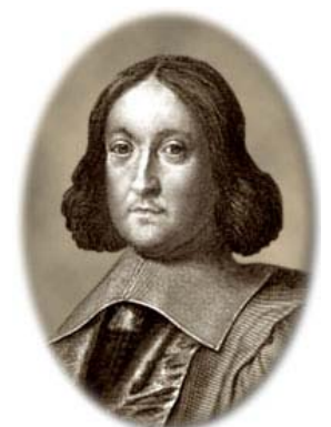
Pierre de Fermat (1601-1665)

és az ezt követő TOVÁBBTANULÁSI TÁJÉKOZTATÓRA