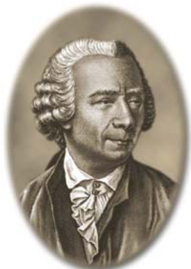
Leonhard Euler (1707-1783)