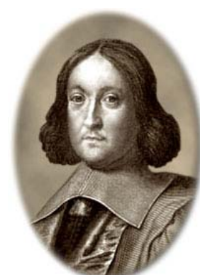
Pierre de Fermat (1601-1665)

Ezt megelőzően 10.20-tól: TOVÁBBTANULÁSI TÁJÉKOZTATÓ !