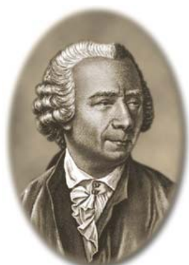
Leonhard Euler (1707-1783)

MIÉRT A PRÍMSZÁMOKTÓL FÜGG BANKSZÁMLÁNK BIZTONSÁGA? című előadására