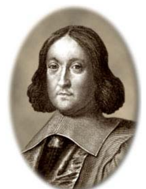
Pierre de Fermat (1601-1665)