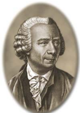
Leonhard Euler (1707-1783)

MIÉRT A PRÍMSZÁMOKTÓL FÜGG BANKSZÁMLÁNK BIZTONSÁGA? című előadására