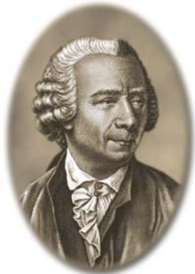
Leonhard Euler (1707-1783)