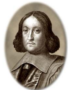
Pierre de Fermat (1601-1665)

és az ezt követő TOVÁBBTANULÁSI TÁJÉKOZTATÓRA